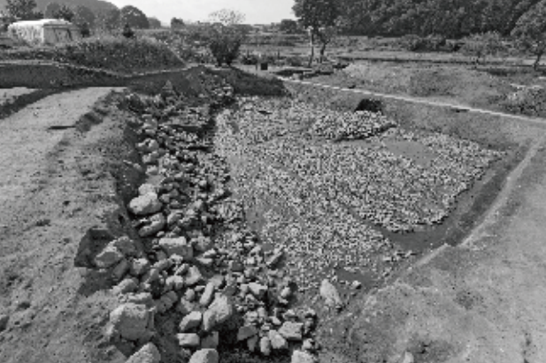
飛鳥京跡苑池(第6次)南池東半全景(北東から)

夏に恒例の発掘調査速報展「大和を掘る」も30回目となりました。当博物館では、市町村教育委員会などのご協力を得て、奈良県内で発掘調査された資料をいち早く展示公開し、多くの方がたにその成果を共有していただけるように努めてまいりました。今回は、主に2011年度に発掘調査された遺跡から、のべ36遺跡の成果を展示します。また、今回は30周年を記念しての講座や、県内市町村の埋蔵文化財展示施設を紹介します。