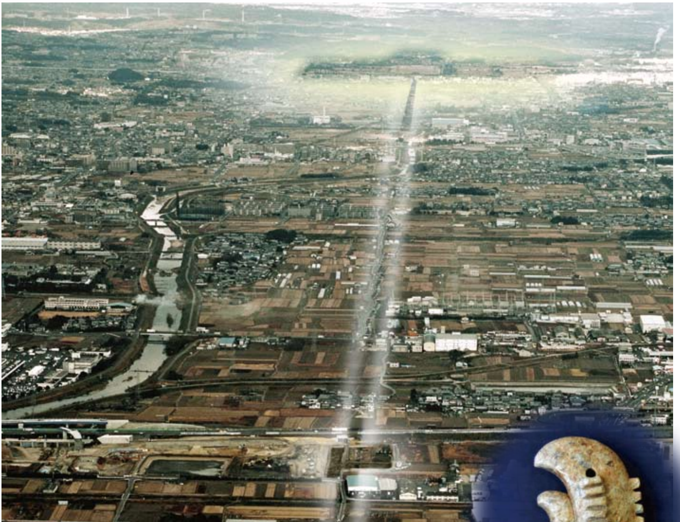
八条北遺跡・下ツ道(調査地を手前に平城京をのぞむ)