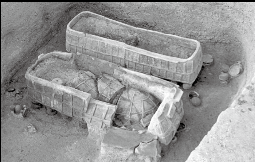
赤田横穴墓群 5号墓 墓室内